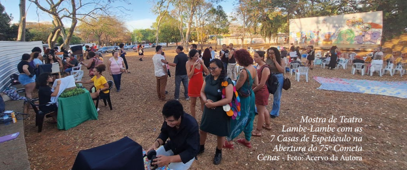
Mostra de Teatro Lambe-Lambe com as 7 Casas de Espetáculo na Abertura do 75º Cometa Cenas

No teatro lambe-lambe, a caixa cênica não é só abrigo, é pacto. Um teatro do “chegar perto”. Um teatro que pede um espectador de cada vez, como se dissesse: vem, encosta o olhar com delicadeza; aqui, o pequeno faz um mundo. Dentro dela, cabem materiais humildes e precisos: dobradiças, fios, papel, madeiras, objetos, sombras. E, de repente, cabem também coisas que não têm mão: saudade, susto, riso, denúncia, ternura, resistência. Cabe aquilo que o recorte preserva vivo, e aquilo que a síntese concentra até o ponto em que o mundo, em miniatura, ainda pulsa inteiro.