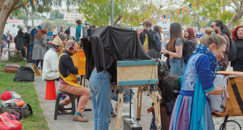
Apresentações de Teatro Lambe-Lambe. Parque Cultural de Valparaíso, Chile. FESTILAMBE de 2024

celeração e se opõe à pressa cotidiana. Nesse espaço mínimo, o tempo se dilata e transforma poucos minutos em experiência sensível, convidando o espectador a viver o presente.